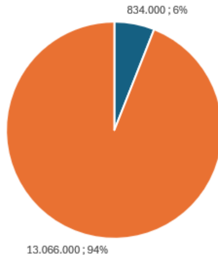
(Abb. 1 - Kreisdiagramm)

Etwa 2-6% der Kinder in Deutschland leiden unter ADHS (Aufmerksamkeitsdefizit - Hyperaktivitätsstörung) (Q1 - https://www.bundesgesundheitsministerium.de/ ), was immerhin zwischen rund 300.000 und 830.000 Kinder und deren Eltern betrifft.